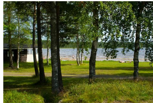
Rannan länsipuolen metsikkö ja saunarakennus