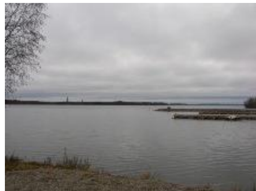
Uimaranta kaakkoon, oikealla venelaiturit