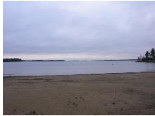
Uimaranta etelään päin